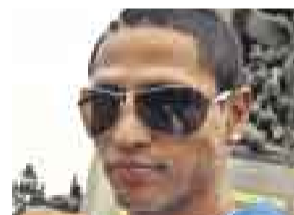
JONATHAN MAICELO BOXEADOR

“Como mi madre, estudié en el colegio Villa María. Allí recibí los conocimientos con los que luego ingresé a la universidad. Pero confieso que en las clases no se interesaban mucho por las artes ni por la libertad de expresión artística. En ese tiempo los niños me parecían extraños y yo era muy tímida. Por eso relacionarme con el sexo opuesto me daba mucho temor, los veía muy agresivos. Si hubiera estudiado en un colegio mixto, esto tal vez no hubiera ocurrido”.