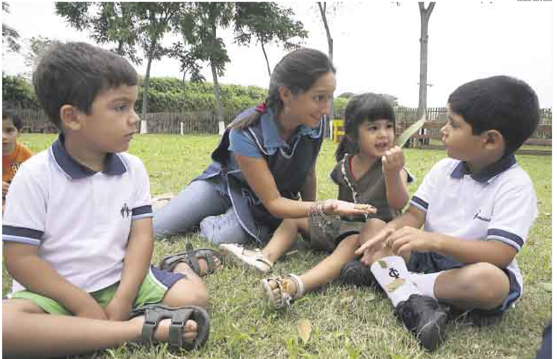
LA HISTORIA CAMBIA. Unas 50 niñas de entre 4 y 5 años ingresaron este año al colegio La Inmaculada de Surco, que después de 131 años se abre a la educación mixta.