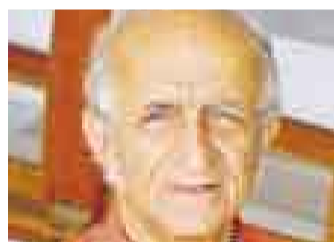
FERNANDO DE SZYSZLO ARTISTA PLÁSTICO