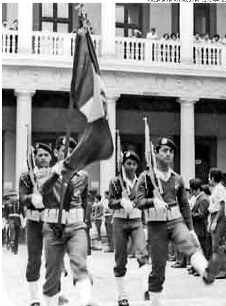
EMBLEMÁTICO. El colegio Nuestra Señora de Guadalupe cumple en noviembre 170 años educando solo a varones.

¿Pero cuándo el concepto de educación diferenciada empezó a dar paso a la coeducación? El especialista en temas de edu-